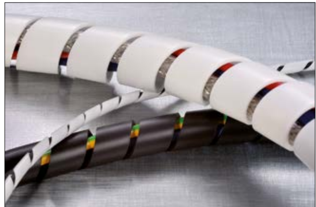
Spiralschlauch SBPEFR ist in mehreren Größen in Schwarz und Weiß erhältlich.