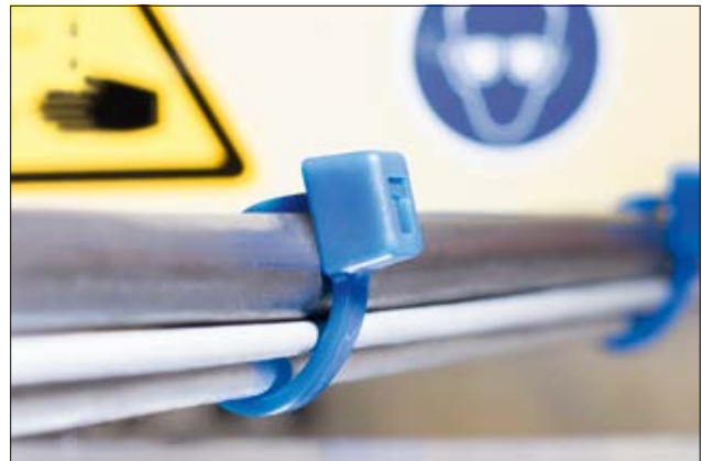
E/TFE Kabelbinder der T-Serie für den Einsatz bei erhöhten chemischen Anforderungen und Temperaturen bis +170 °C.