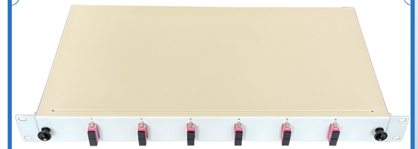
Vorderansicht – geschlossen