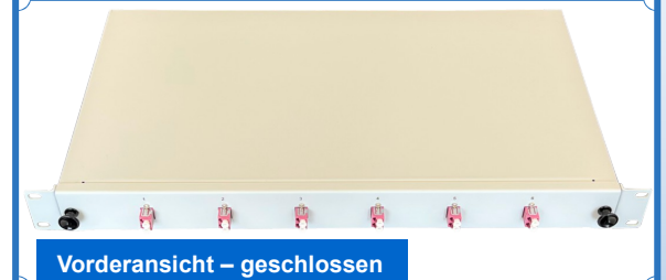
Vorderansicht – geschlossen