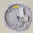
HF-Modul HF-Bewegungssensor zur Nachrüstung