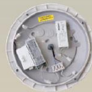
Notstrom-Modul zur Nachrüstung