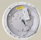
Standard-Modul MultiLumen-Treiber: dreistufig einstellbare Helligkeit (2000lm, 1500lm, 1000lm)

Gezielt Vorbeugen ist besser als ständiges Austauschen: Die LED-Feuchtraum- und Außenleuchten FONDA sind aus extrem robustem Kunststoff gefertigt (Schlagfestigkeitsklasse IK10). Dadurch widerstehen sie versehentlichen Beschädigungen oder bewussten Vandalismus-Angriffen. Typische Anwendungsgebiete sind Außenanlagen, Flure und Treppenhäuser, Sanitärräume sowie Gemeinschaftsunterkünfte. Der HF-Bewegungssensor kann nachgerüstet werden. Die Helligkeit kann auf 2.000 lm, 1.500 lm oder 1.000 lm eingestellt werden. Das schlagfeste Gehäuse ist weiß oder silber und hat optimierte seitliche Kabelzuführungen für die Aufputzinstallation.