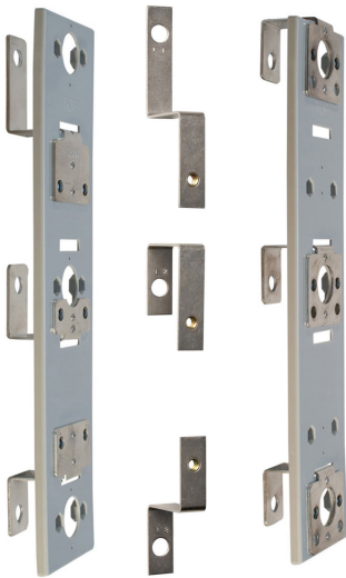
MZ00DSA MZ00ESAECO MZ01DSA