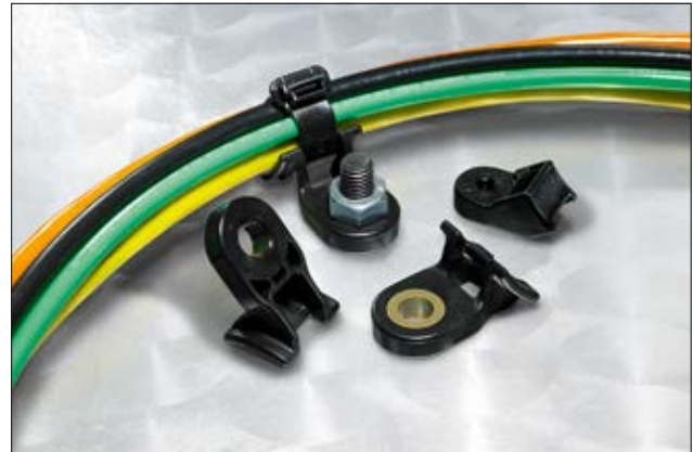
HDM (Heavy Duty Mounts) sind bestens für Schwerlastanwendungen geeignet.