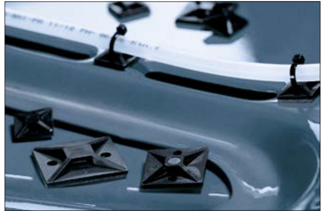
Durch das SolidTack Klebeband können die Sockel auch auf lackierte Oberflächen geklebt werden.