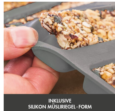
INKLUSIVE SILIKON MÜSLIRIEGEL-FORM