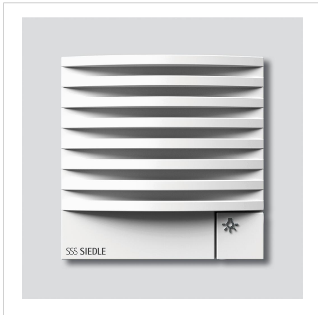
Bus-Türlautsprecher- Modul BTLM 650-04 W 200036816-00