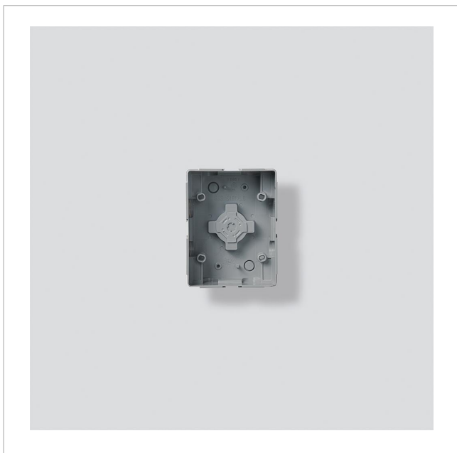
Unterputzgehäuse GU 611-1/1-0 200016701-00