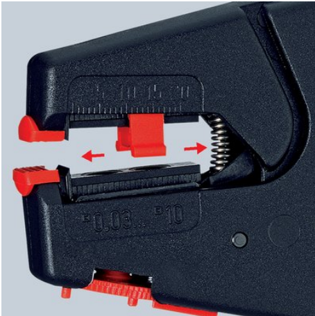
12 40 200: Einstellbarer Längenanschlag