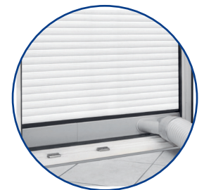
Inkl. Fenster-Kit und Abluftschlauch