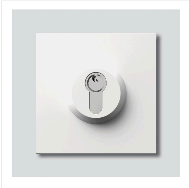
Schloss-Modul SM 611-01 W 200019404-01