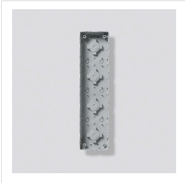
Unterputzgehäuse GU 611-4/1-0