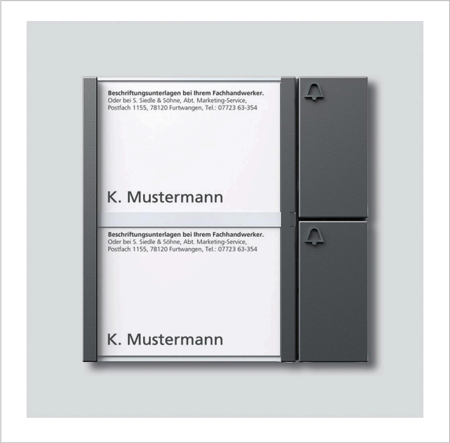
Tasten-Modul TM 612-2 DG 200038757-00

Tasten-Modul mit Namensschildtasche, 2 Namensschildern und 2 separaten Ruftasten mit Glockensymbol.