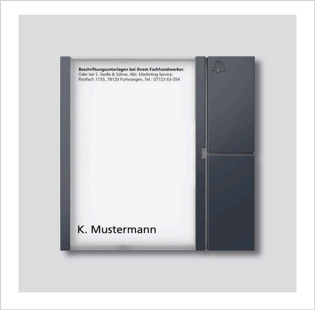
Tasten-Modul TM 612-1 AG 210004997-00

Tasten-Modul mit Namensschildtasche und 1 separaten Ruftaste mit Glockensymbol.