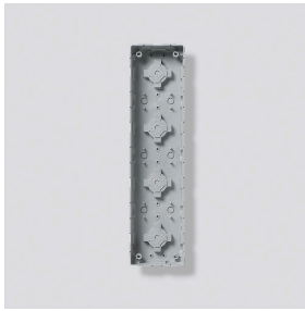
Unterputzgehäuse GU 611-4/1-0