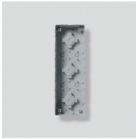
Unterputzgehäuse GU 611-3/1-0