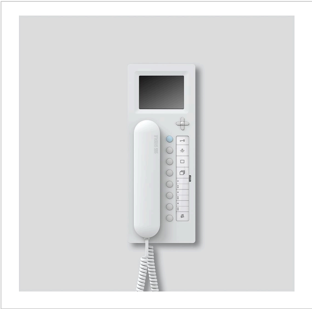
Access Haustelefon Video AHTV 870-0 W 200041340-00

Access Haustelefon Video mit Türöffnertaste sowie 7 weiteren Tasten mit 2-farbiger Status-LED. Alle Tasten sind frei programmierbar. Das Display zeigt das Kamerabild und die grafische Menüoberfläche.