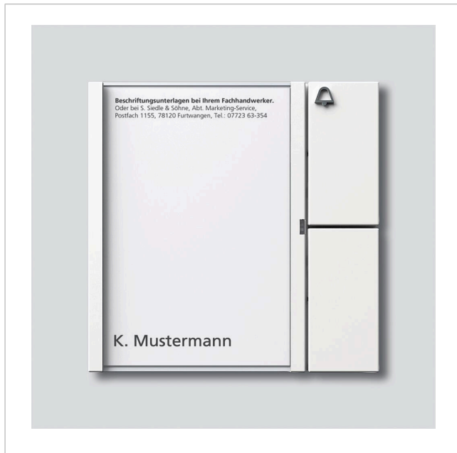
Taster-Modul TM 612-1 W 200035513-00