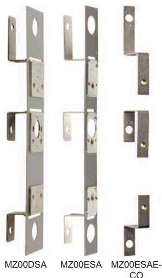
MZ00DSA MZ00ESA MZ00ESAE-CO

NH-Sicherungs-Lastschaltleisten Größe 00 160 A AC 690 V